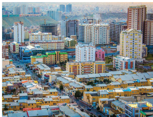
شهرک رشدیه Roshdiyeh town

The residential-commercial complex project on the western side of Fahmideh Square will be built on a land of 5.000 m2 with 13 floors and 176 apartment units along with a commercial floor. The built-up area of the whole complex is about 32000 m2 and in terms of landscape, height, and urban location, it is one of the high-quality urban areas with a good economic justification.